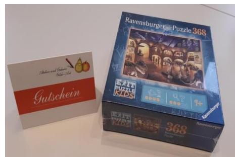
GildeArt-Malgutschein in Höhe von: