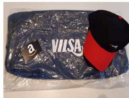
Amazon-Gutschein im Wert von: