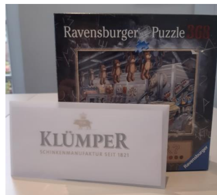
Klümper-Gutschein in Höhe von: