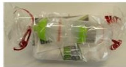
Flasche, Handtuch und 4 Wochen Training in der formBAR