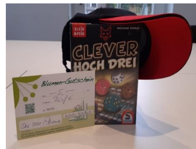
Blumengutschein (Schulte Nordholt) in Höhe von: