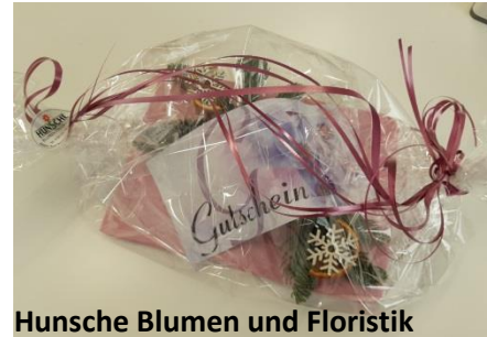
Hunsche Blumen und Floristik