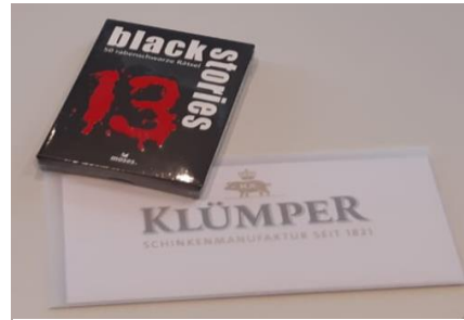
Klumper-Gutschein in Höhe von: