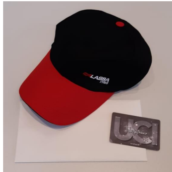
UCI-Kinogutschein für einen 2D Film Gutschein für ein Kinder- oder Jugendbuch von Holscher und Beernink