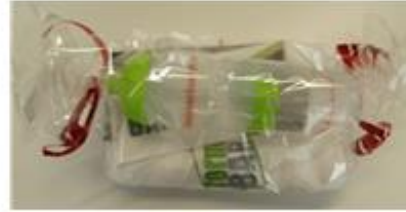
Flasche, Handtuch und 4 Wochen Training in der formBAR